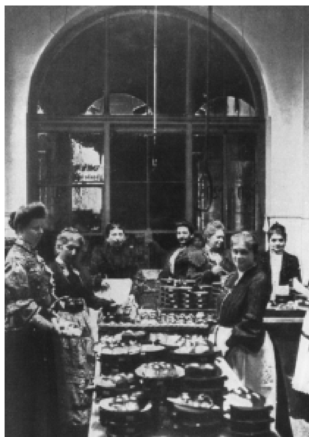
Von 1889 bis 1921 befindet sich hier auch die von badischen Frauenverein betriebene Volksküche, die zur Unterstützung armer Bevölkerungskreise gegen geringes Entgelt Suppe ausgibt.