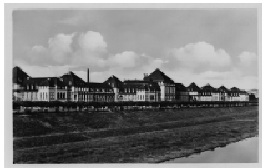
Neubau des Städtischen Krankenhauses auf dem rechten Neckarufer.

Das 1730-1735 gebaute Karl-Borromäus-Spital ist eine kurfürstliche Einrichtung zur Versorgung armer und kranker Hofbediensteter und ihrer Angehörigen. Die entsprechende städtische Einrichtung heißt Nothaus und befindet sich in J 2, 14.