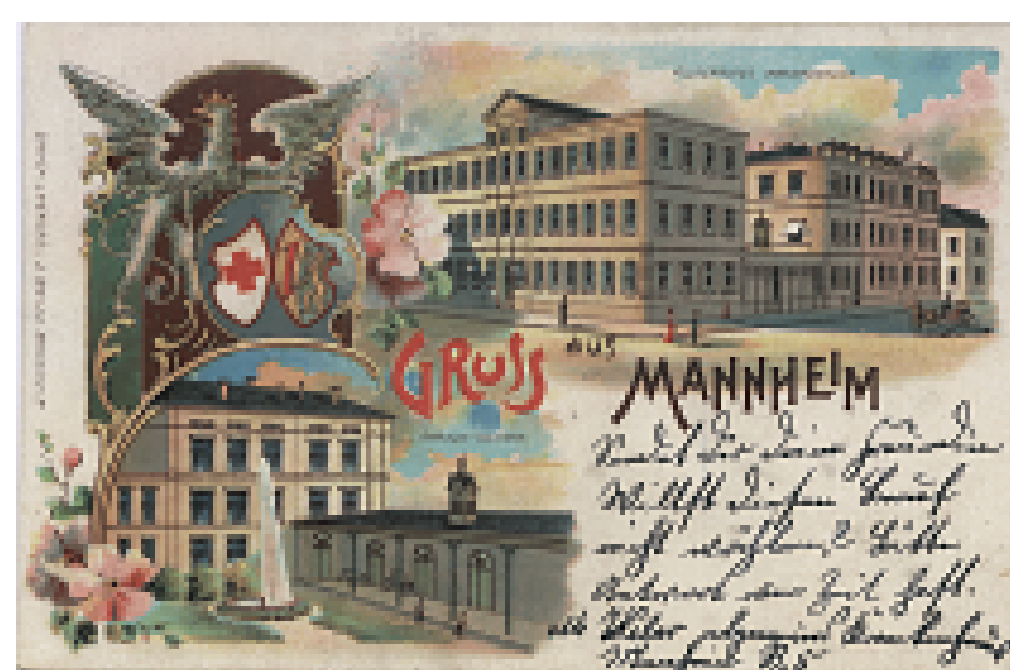
Postkarte des Allgemeinen Krankenhauses in R 5 mit Außen- und Gartenansicht, 1904.